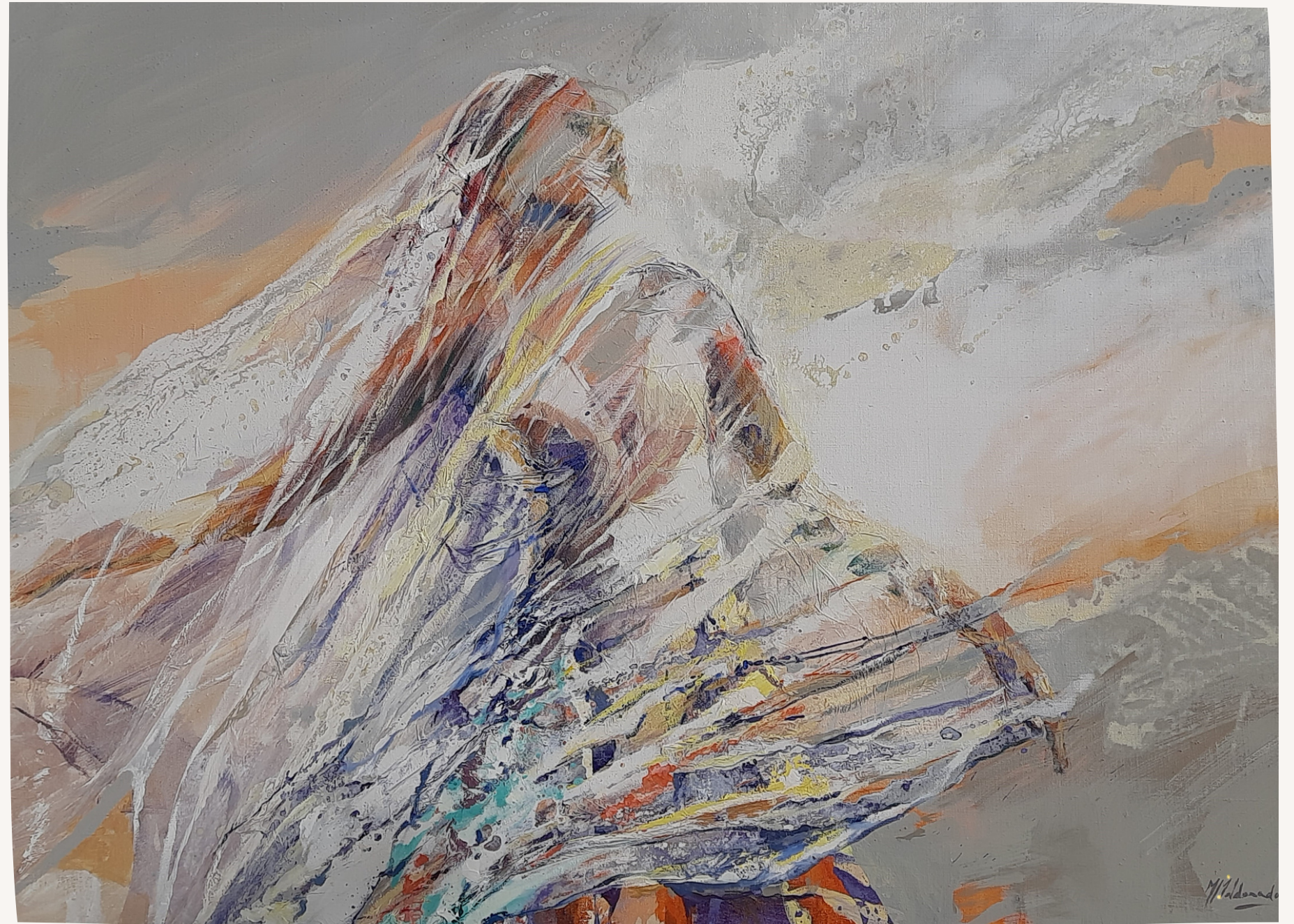
Obra: Marta Maldonado