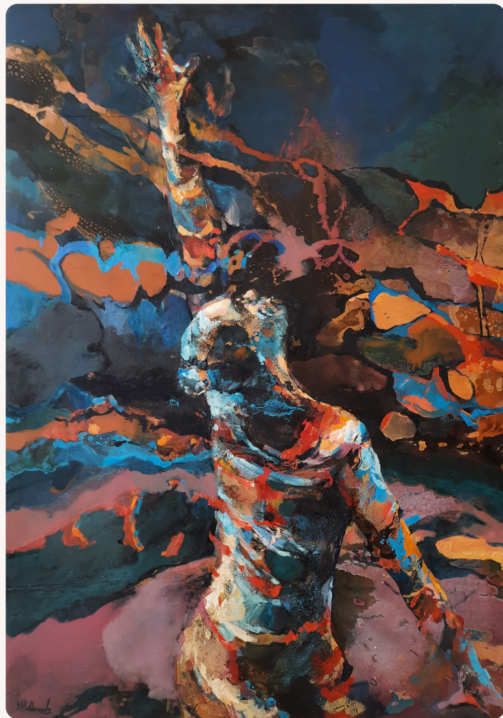
Obra: Marta Maldonado