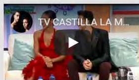
TELEVISIÓN CASTILLA LA MANCHA